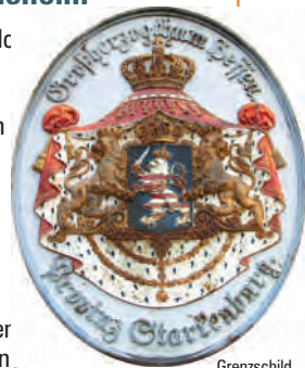
Grenzschild am Museum

Das nach Norden eingeschossige, nach Süden zweigeschossige traufständige Museumsgebäude geht wohl auf der Rest des ehemaligen Lorsch Klosterhofes zurück. Die südliche Fachwerkwand über dem wahrscheinlich älteren, massiven