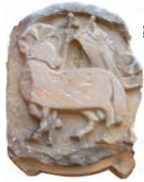
Spolie an der Fassade

ne zu Ehren des heiligen Michael errichtete Basilika können wir am höchsten Punkt der Altstadt schon für das frühe Mittelalter vermuten.