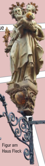
Figur am Haus Fleck