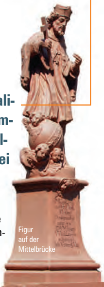
Figur auf der Mittelbrücke

Überaus repräsentativ beherrscht die 1732 errichtete ehemalige Domkapitelfaktorei