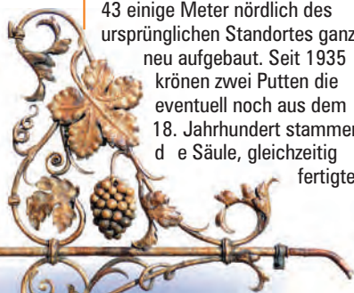
Ausgussrohr am Hospitalbrunnen

Der Brunnenstandort am Hospital ist bereits für das Jahr 1526 nachzuweisen. Der 1711 mit einer Säule und krönender Kugel erneuerte Brunnen wurde 1842/43 einige Meter nördlich des ursprünglichen Standortes ganz neu aufgebaut. Seit 1935 krönen zwei Putten die eventuell noch aus dem 18. Jahrhundert stammende Säule, gleichzeitig fertigte